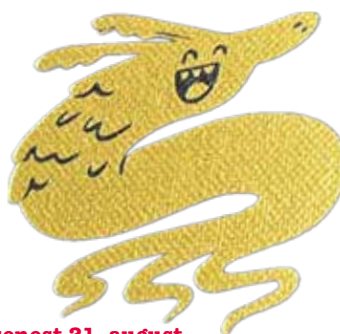
Illustration: Zarah Juul

s. 5_Tilmelding: fs-gentofte.dk senest 21. august