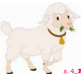
Illustration: Laura Mølgaard Sørensen

s. 4_Materialer leveres på skolen ca. 3 uger før projektstart