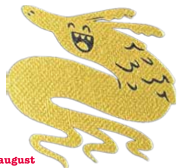
Illustration: Zarah Juul

s. 9_Tilmelding: fs-gentofte.dk senest 21. august